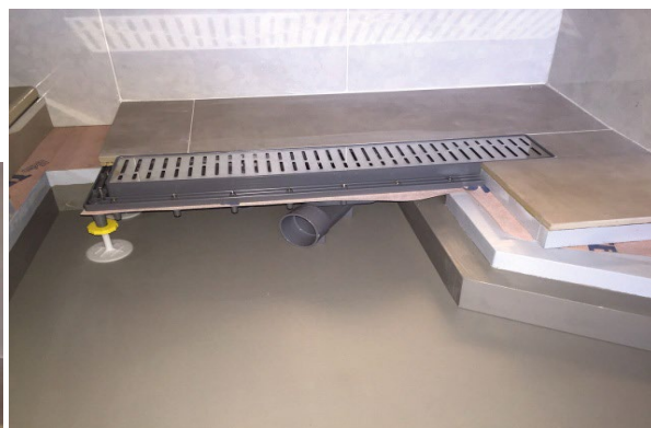
SIMULAÇÃO DE APLICAÇÃO EM OBRA